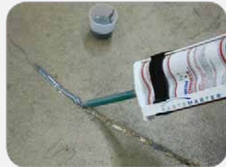
Doctor Ciovacco auto-nivelante fluye en las grietas y astillas para reparar rápidamente el concreto.